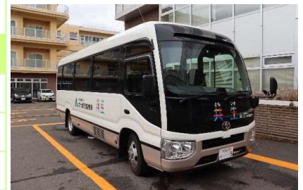
(主に運行しているマイクロバスです)