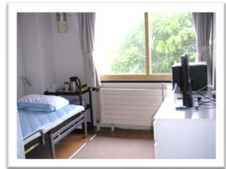
*各居室に押し入れあり