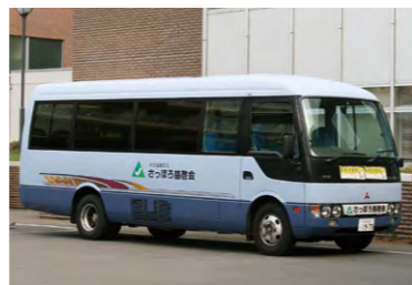
主に運行しているマイクロバスです

〒064-0941 札幌市中央区旭ヶ丘5丁目6-50 TEL:(011)561-8292 FAX:(011)551-3862 http://www.sapporojikeikai.or.jp/